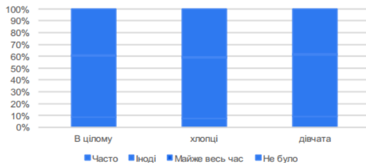
Рис 2. Дослідження проявів пригнічення, яке охоплює дитину під час військових дій ( не залежно від статі) %