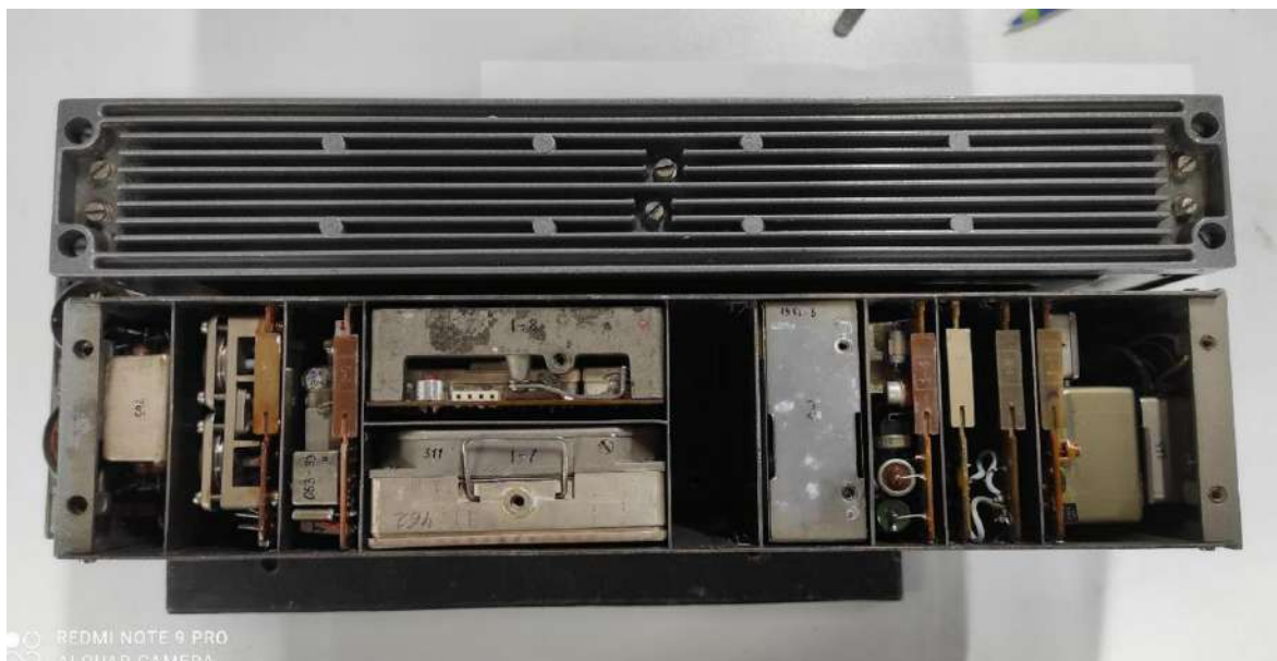
Рис. 1.4. Зображення зверху конструкції блоку 1.

Блок приймача-збудника (Рис. 1.4) включає в себе наступні функціональні вузли: синтезатор, УВЧ, УПЧ, УНЧ, аварійний приймач, блок комутації, збуджувач, перетворювач постійної напруги.