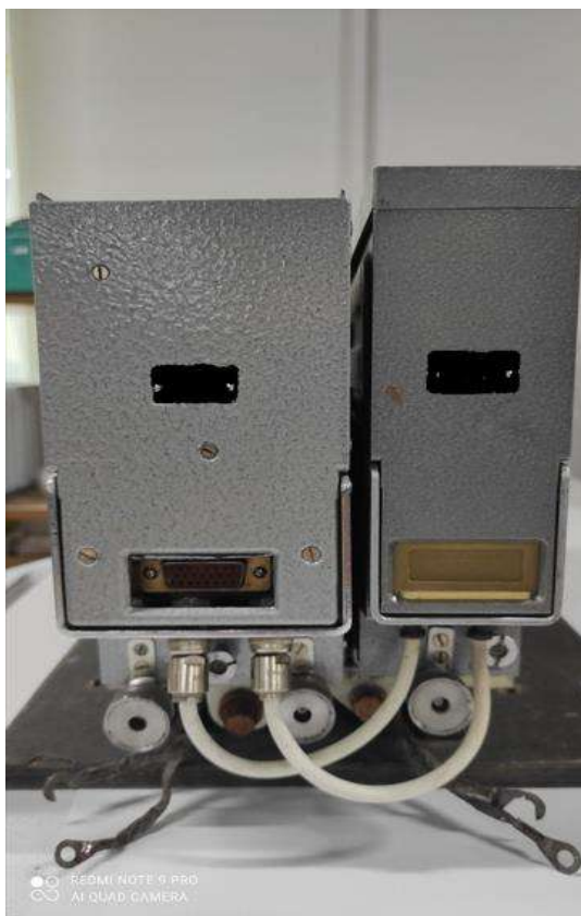
Рис. 1.2. Зображення радіостанції Р-863 ліворуч блок 1 (приймач-збудник), праворуч блок 2 (передавач).