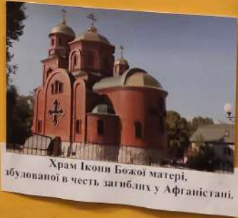
Храм Ікони Божої матері, збудованої в честь загиблих у Афганістані.