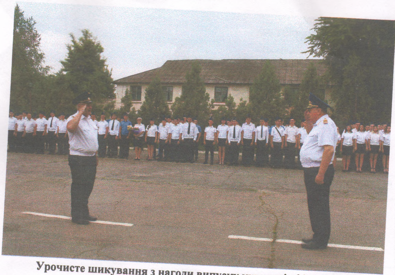
Урочисте шикування з нагоди випуску курсантів 2019 року (23 червня 2019 року)