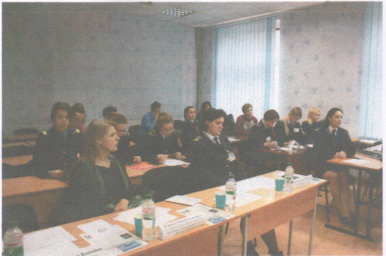
Конференція «Авіація та космонавтика» (16 квітня 2019 року)