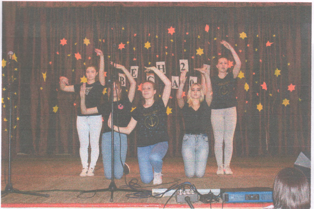
Виступ курсантів на гала-концерті щорічного фестивалю «Студентська весна - 2019» (22 травня 2019 року)