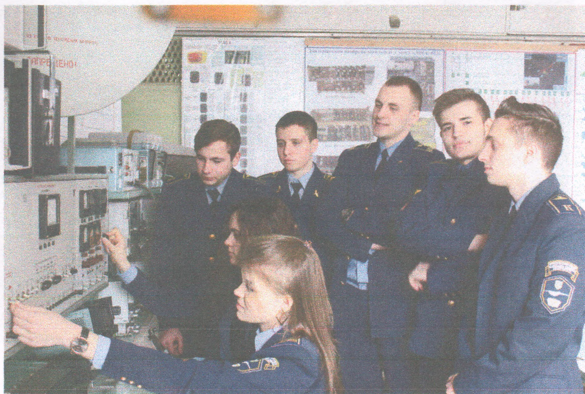
День відкритих дверей (14 березня 2019 року)