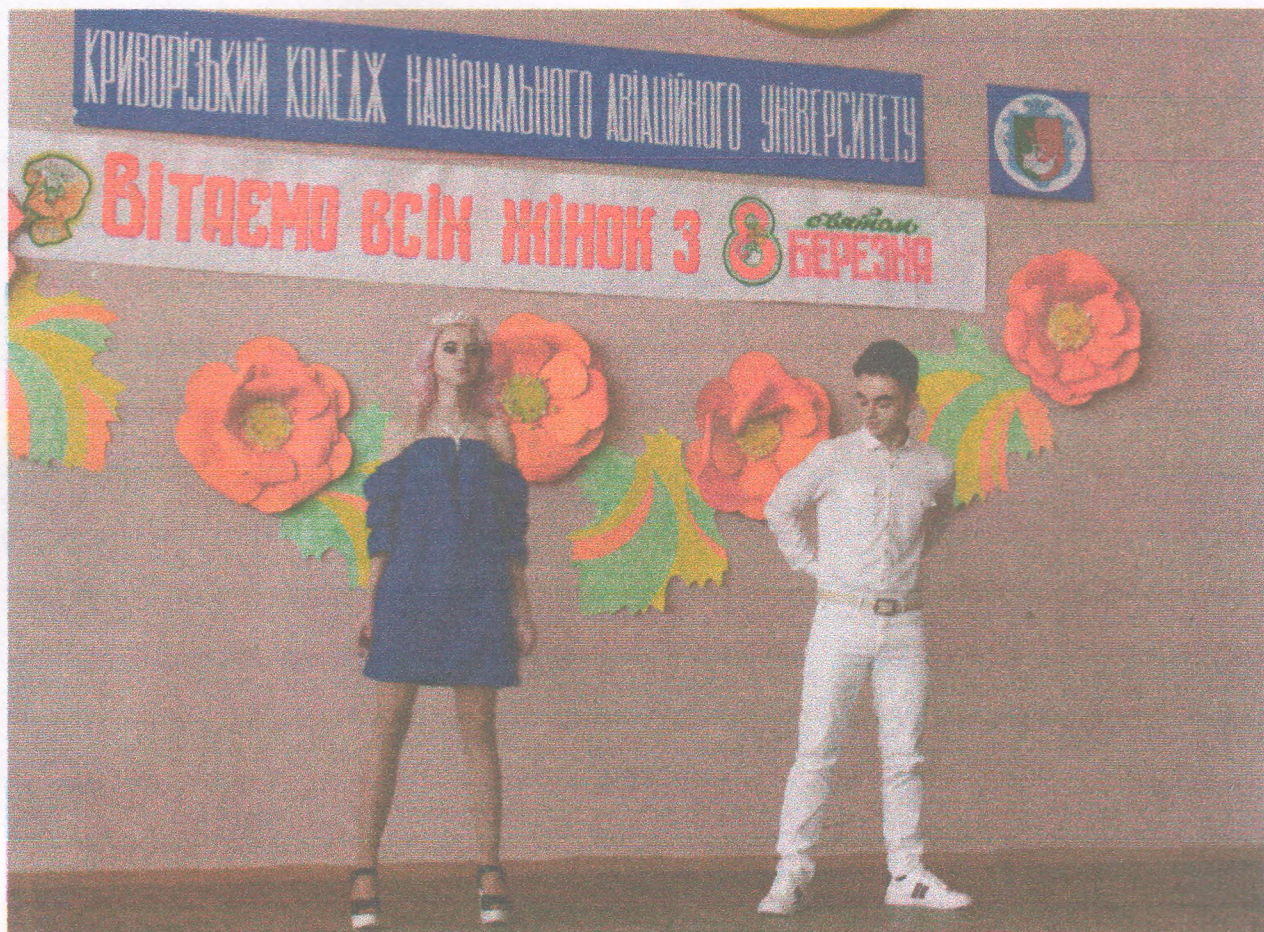
Виступ курсантів на святковому концерті з нагоди Міжнародного жіночого дня (07 березня 2019 року)