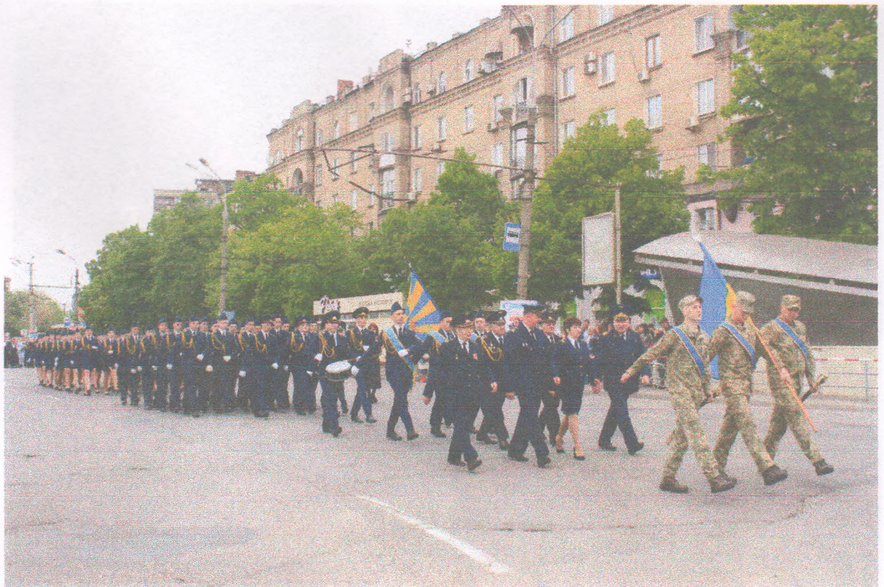
Участь коледжу в міських урочистих заходах з нагоди Дня Перемоги (09 травня 2019 року)