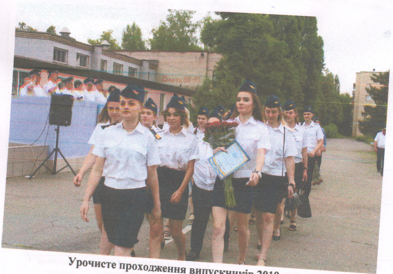
Урочисте проходження випускників 2019 року