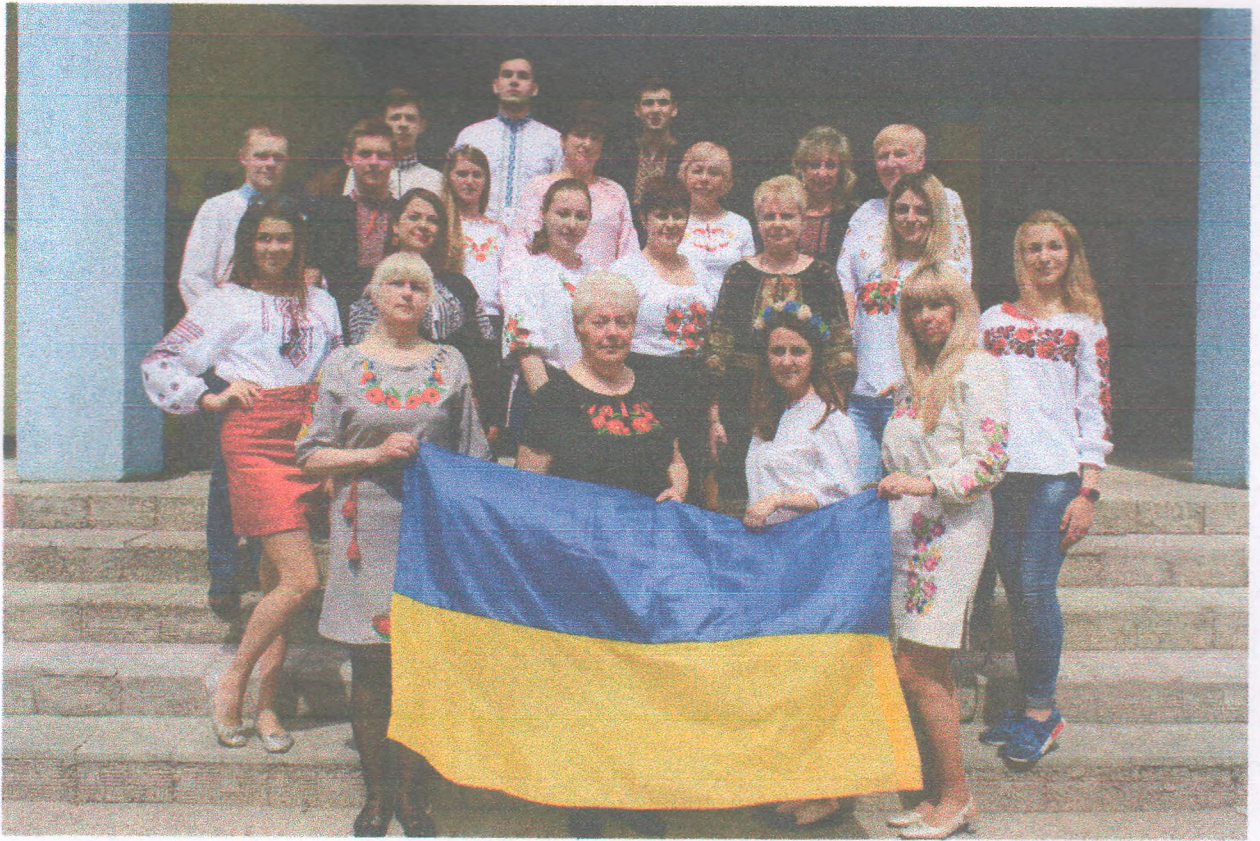
День вишиванки (16 травня 2019 року)