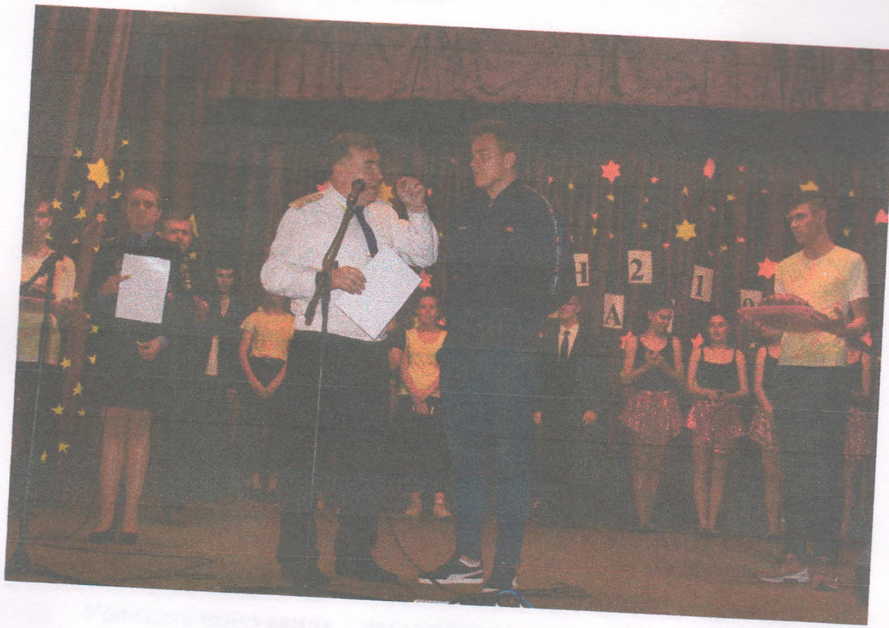
Нагородження переможців щорічного фестивалю «Студентська весна - 2019» (22 травня 2019 року)