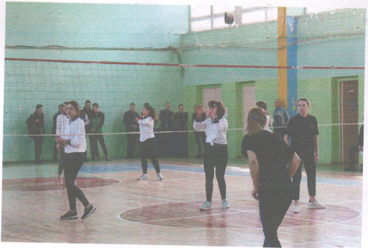
Спортивні змагання з волейболу (18 березня 2019 року)