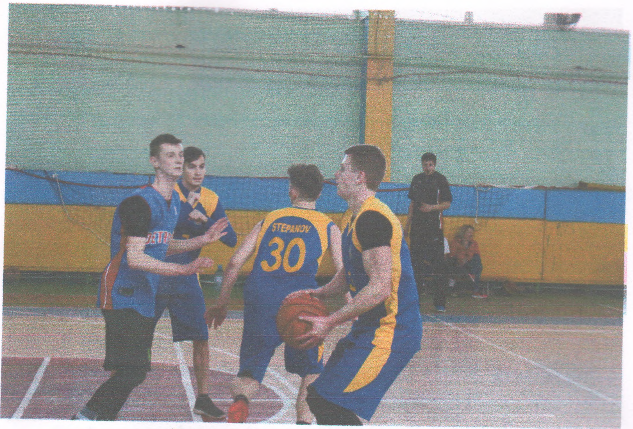
Спортивні змагання з баскетболу (18 березня 2019 року)