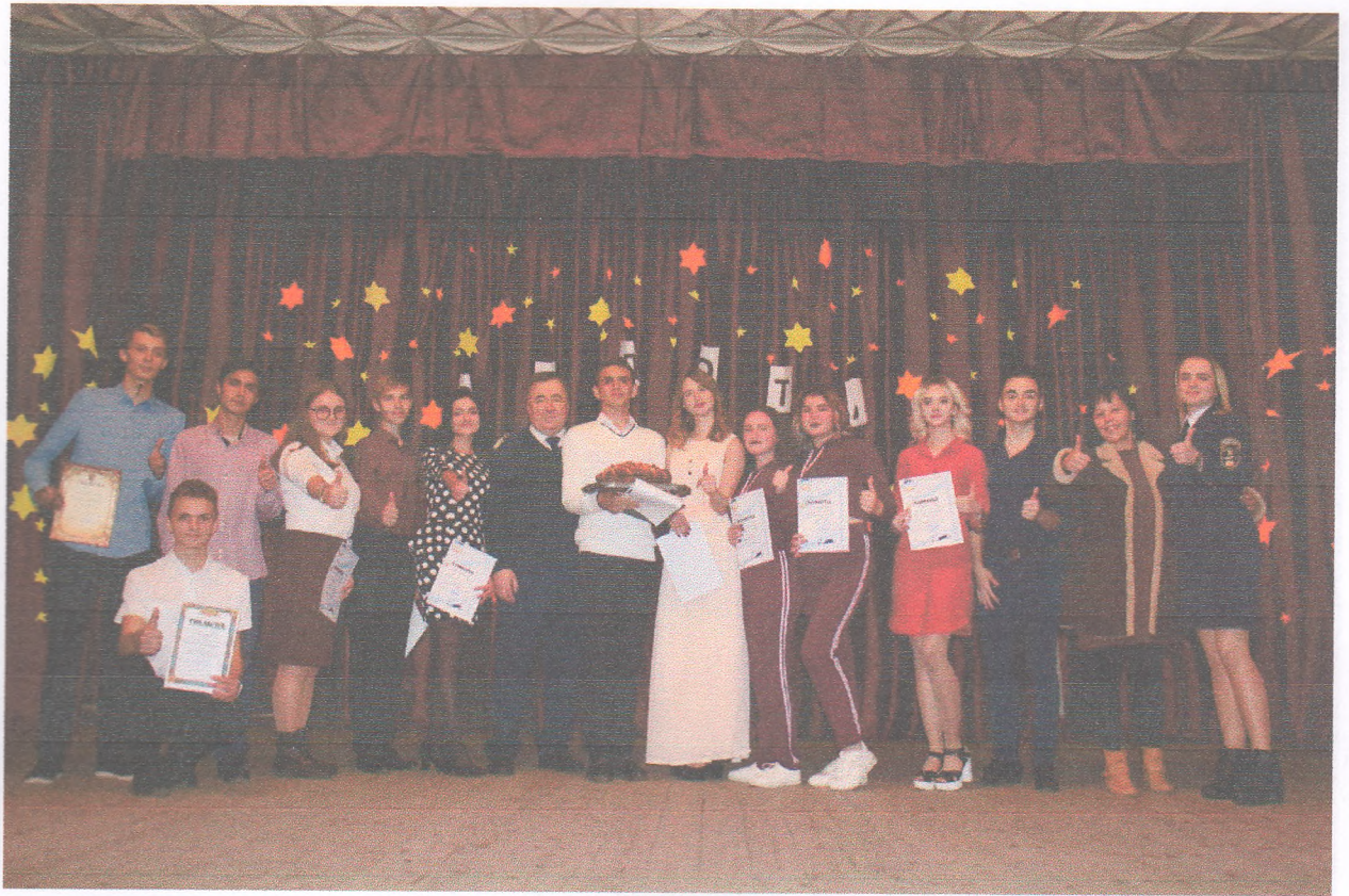
Нагородження за кращі виступи на щорічному фестивалі «Золота осінь - 2019» (30 жовтня 2019 року)