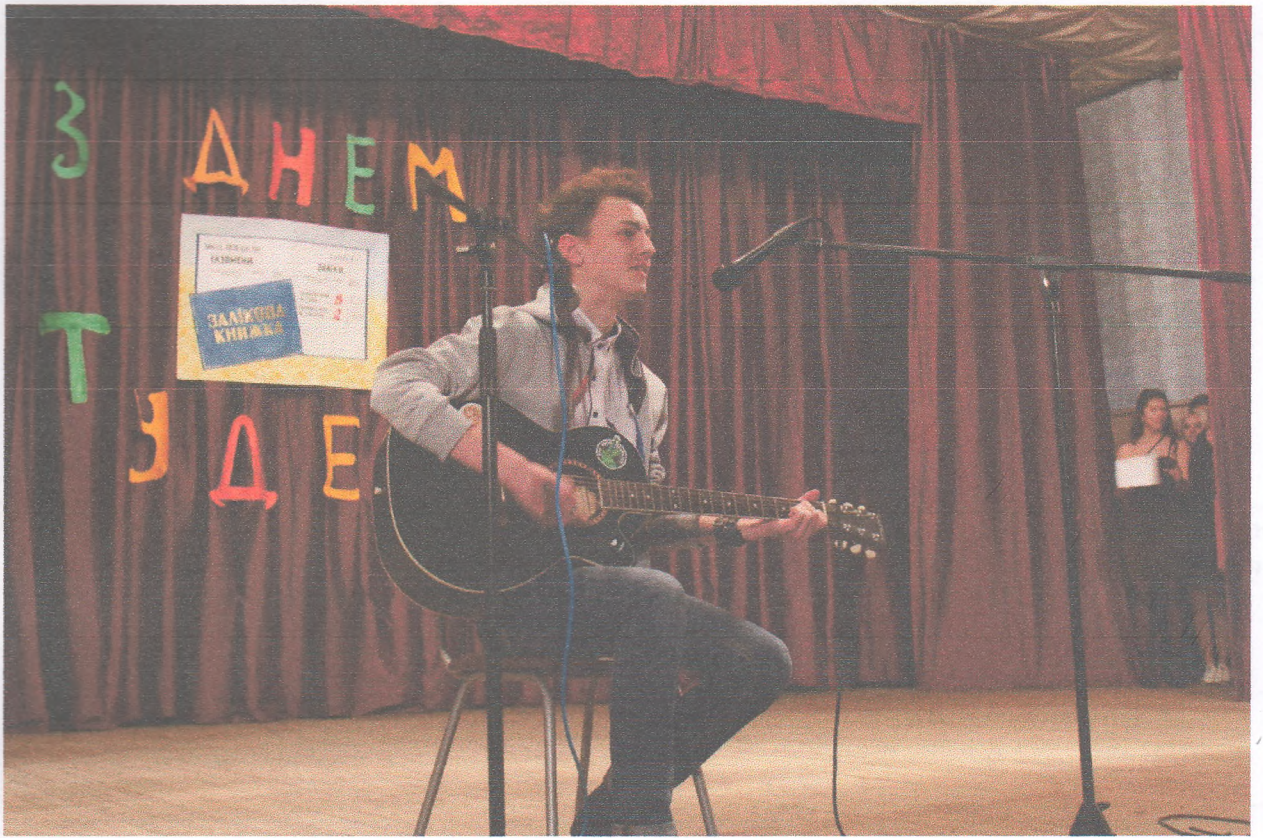
Святковий концерт з нагоди Дня студента (15 листопада 2019 року)