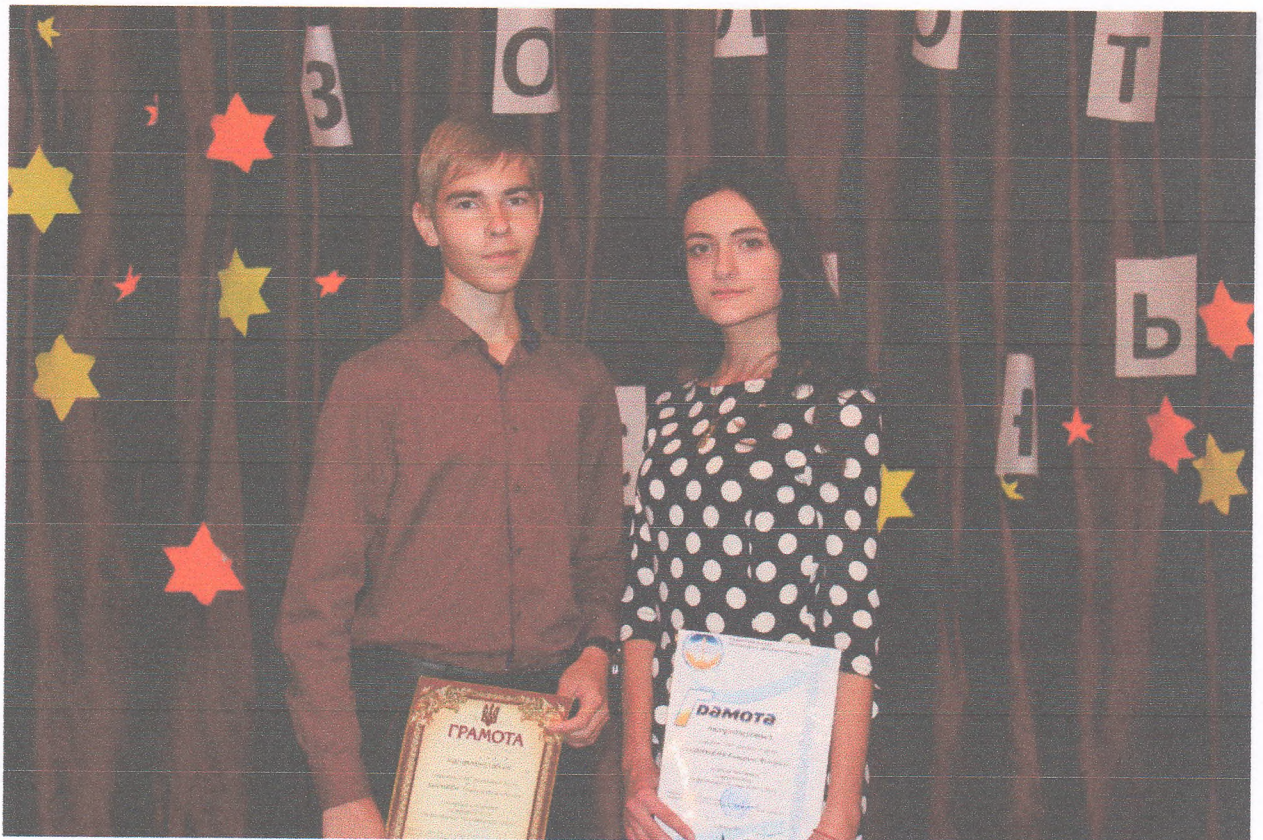
Учасники щорічного фестивалю «Золота осінь - 2019» (30 жовтня 2019 року)