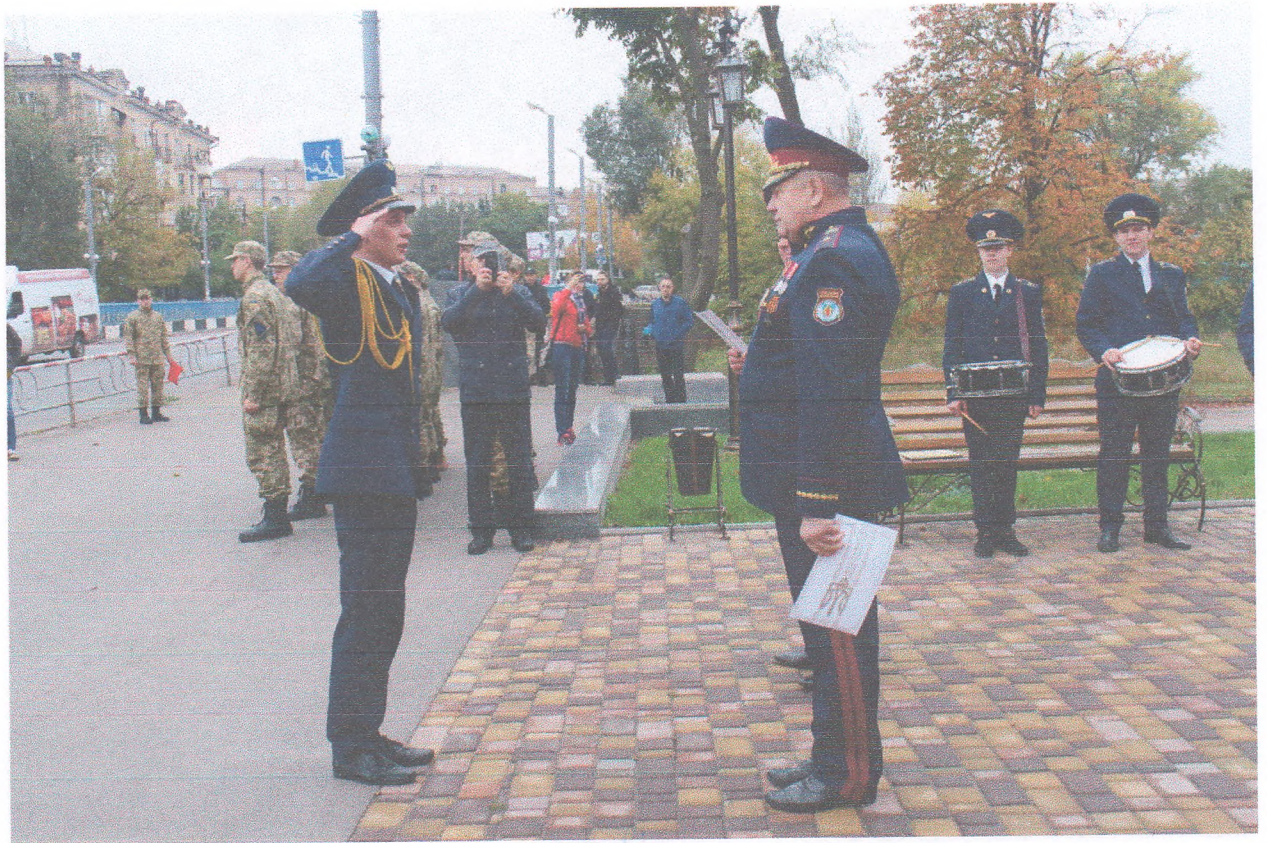
Нагородження курсантів коледжу грамотами з нагоди Дня українського козацтва (14 жовтня 2019 року)