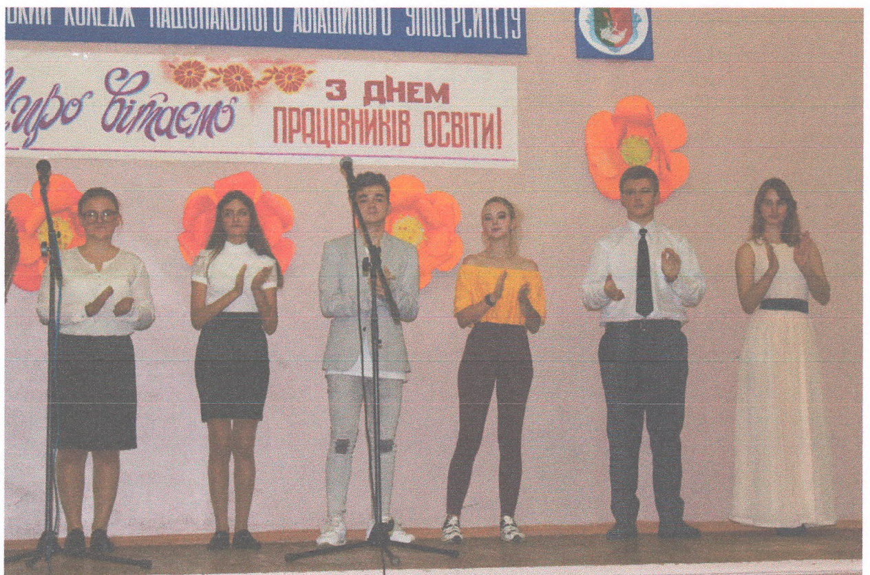
Святковий концерт з нагоди Дня працівника освіти (04 жовтня 2019 року)