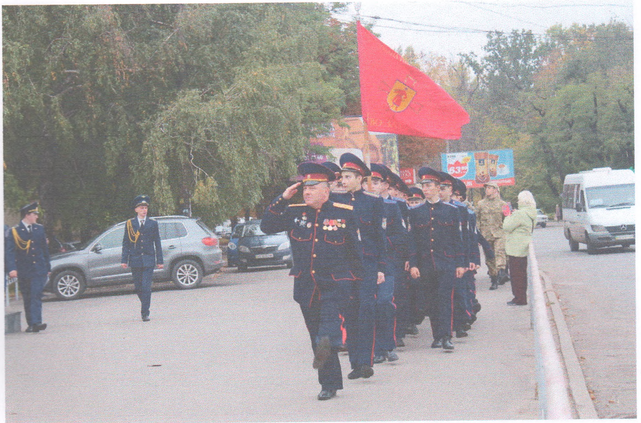
День українського козацтва (14 жовтня 2019 року)