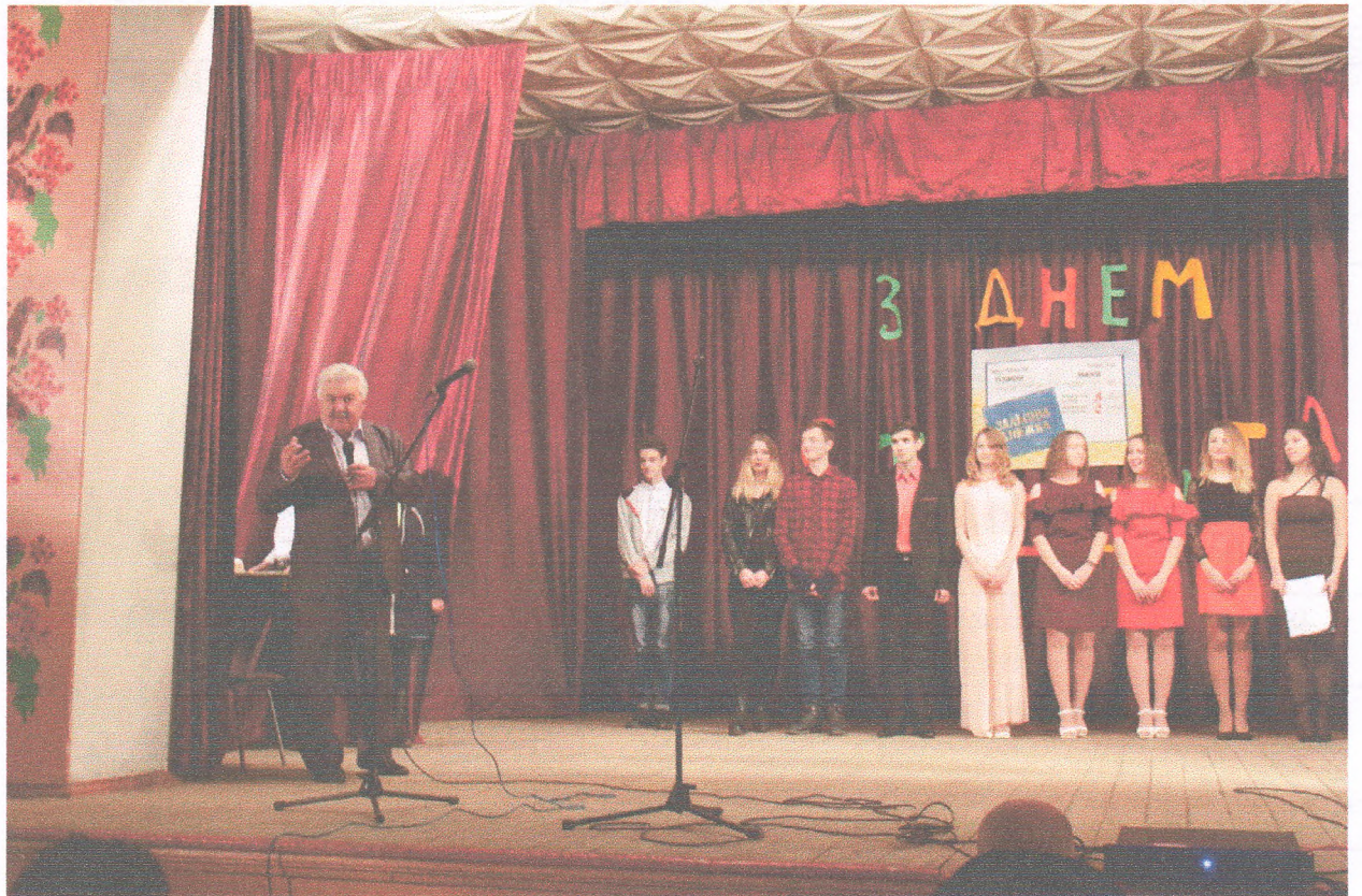
Привітання курсантів та студентів коледжу (15 листопада 2019 року)