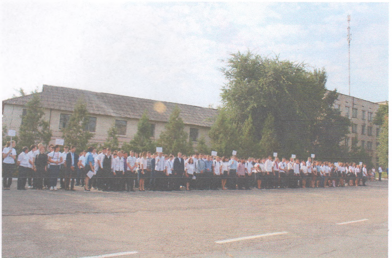
Урочисте шикування з нагоди Дня знань (01 вересня 2019 року)