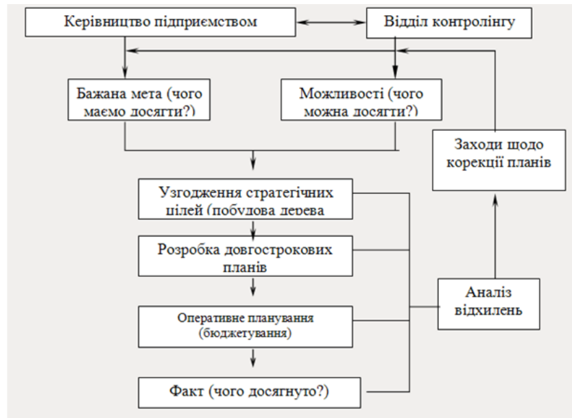
Рис. 3.1 – Структурно-логічна схема планування в рамках системи контролінгу ВАТ «КЦРЗ»