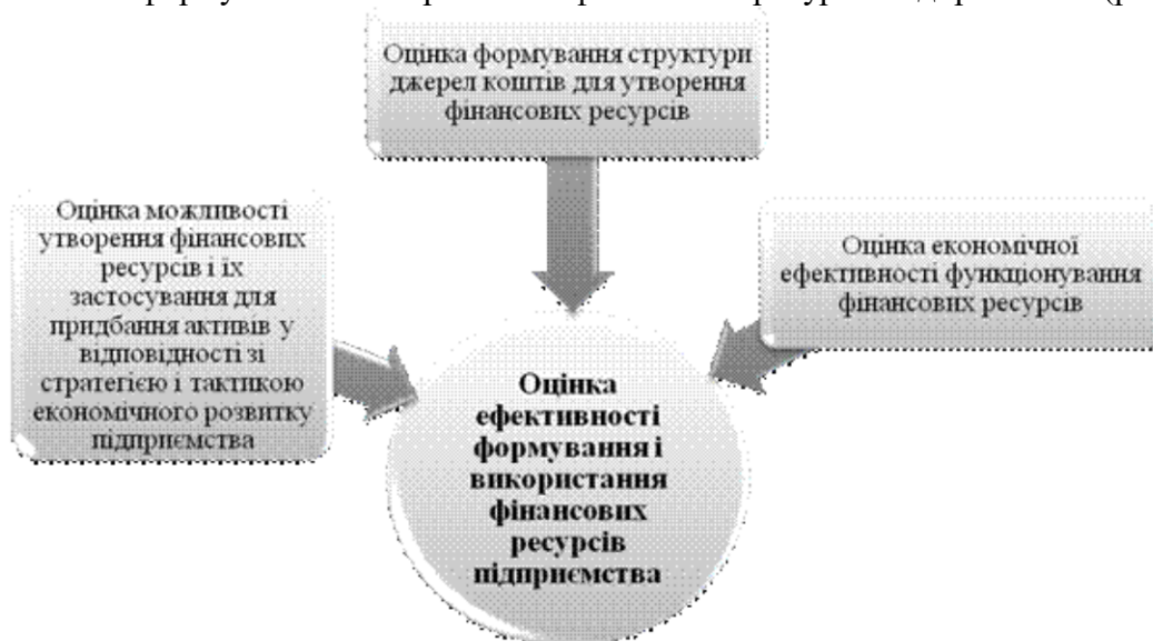
Рис. 1 – Основні напрямки оцінки ефективності формування і використання ресурсів підприємства

\frac{D_v}{Z_v}, \frac{D_{\Pi}}{Z_{\Pi}} – відповідно ресурсовіддача власних і позикових засобів підприємства. Слід зауважити, що такий підхід при складанні моделей узагальнювальних показників ефективності використання фінансових ресурсів підприємства дає змогу проаналізувати не тільки складові доходу, але й фактори, що впливають на їх формування. Дослідивши публікації науковців-економістів Ю.М. Воробйова і Б.І. Холода, можемо визначити наступні основні напрямки оцінки ефективності формування і використання фінансових ресурсів підприємства (рис. 1).