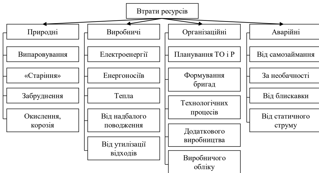
Рис. 1 – Класифікація втрат ресурсів

Організаційні втрати в більшості випадків повністю усунути. Обсяги цих втрат залежать