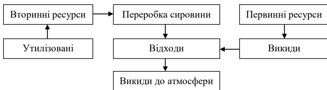
Рис 1 – Схема споживання ресурсів на ТП

2. Транспорт є великим споживачем матеріальних і енергетичних ресурсів, які поділяються на первинні і вторинні (рис. 1).