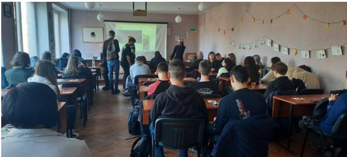
Просвітницька акція «Мова має значення»