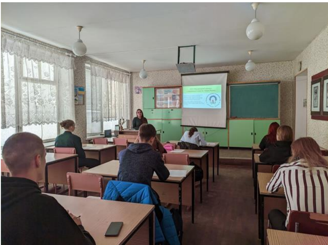
І етап XXIV Міжнародного конкурсу з української мови імені Петра Яцика серед здобувачів освіти 2 курсу