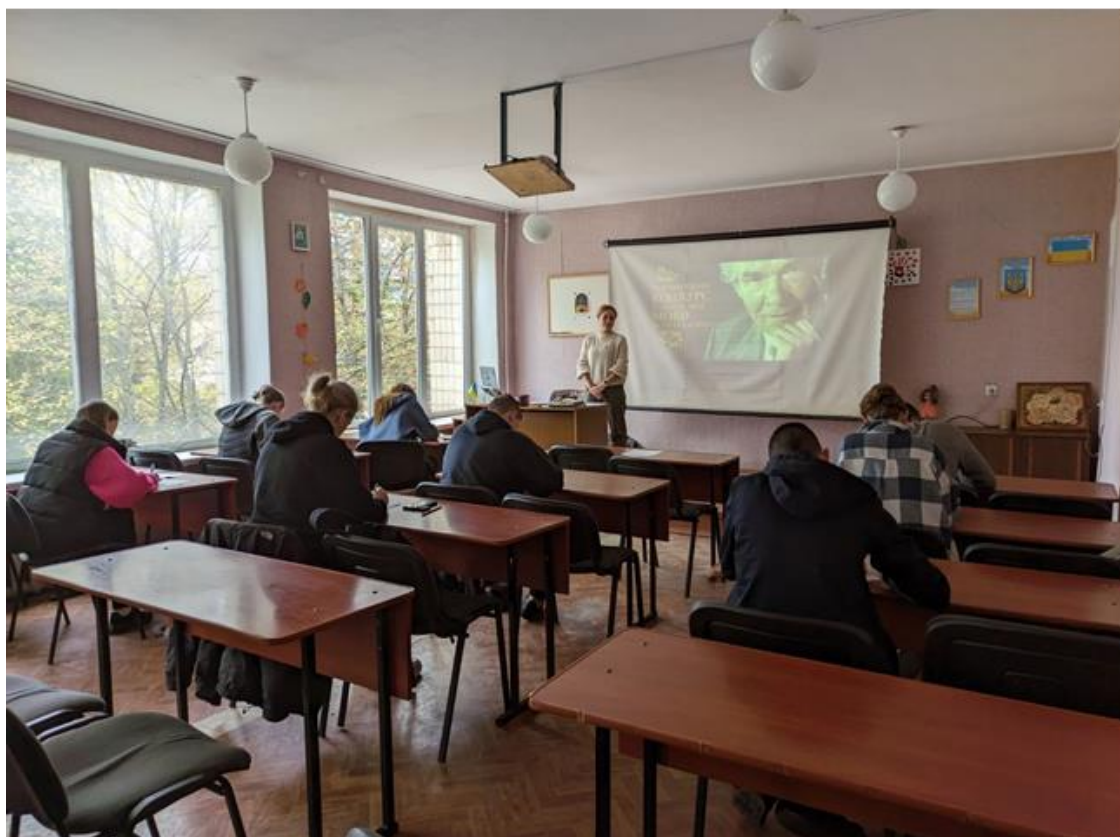
І етап XXIV Міжнародного конкурсу з української мови імені Петра Яцика серед здобувачів освіти 2 курсу