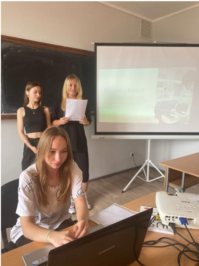
Здобувачі групи 7-032