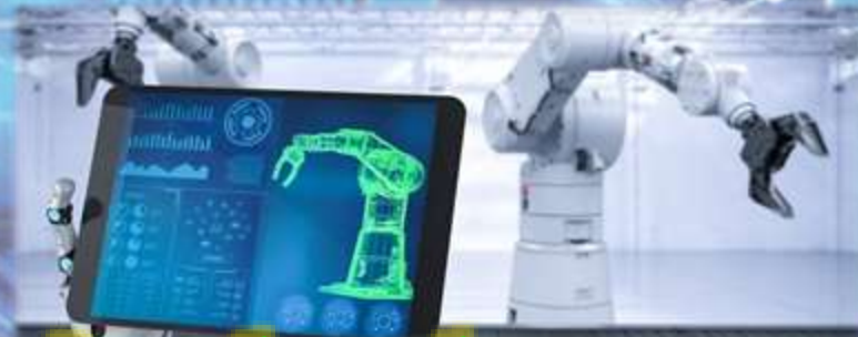
Розробка роботизованих систем та систем автоматики