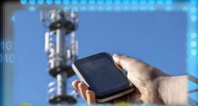
Системи мобільного зв'язку