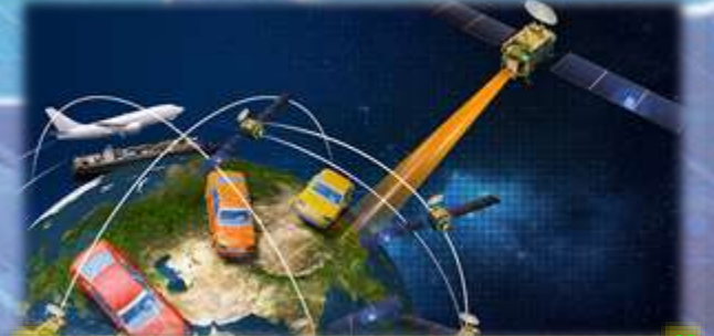
Системи супутникової навігації