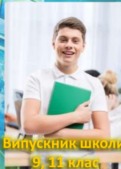
Випускник школи 9, 11 клас