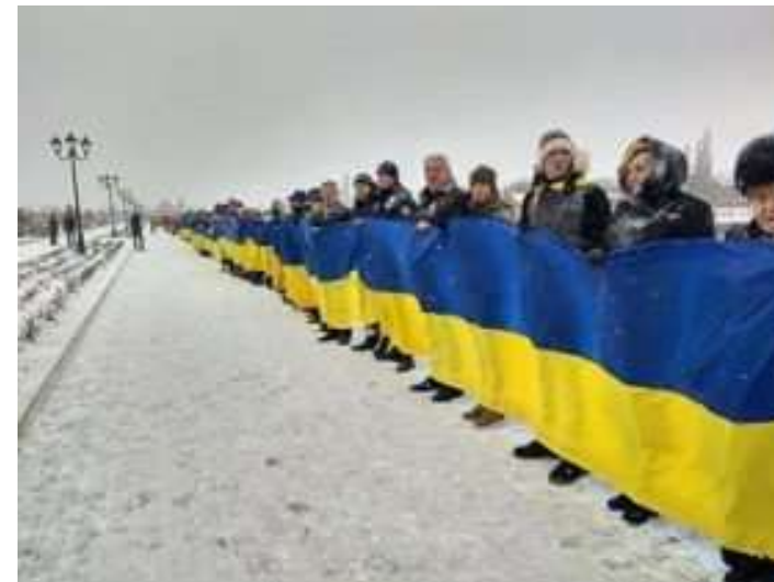
Символічний ланцюг єдності до Дня Соборності. Бахмут, 2018р