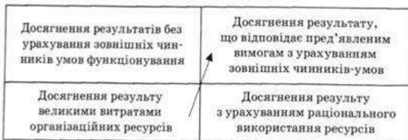
Рис. 1 – Модель ефективності діяльності організації

Як видно з моделі ефективності діяльності організації, представленої на рис. 11.1, підвищення організаційної ефективності можливе за умови, що діяльність організації здійснюється у напрямі досягнення мети, зафіксованої в правому верхньому кутку схеми, тобто якщо забезпечується зниження витрат і дотримуються умови, що відповідають потребам суспільного розвитку.