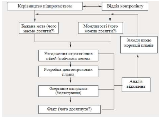
Рис. 3.1 – Структурно-логічна схема планування в рамках системи контролінгу ВАТ «КЦРЗ»