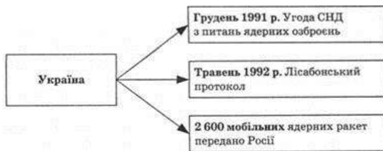
Рис. 15.7. Шлях України до без'ядерного статусу

Проголошення принципів без'ядерності та позаблоковості було не найгіршим із усіх можливих рішень. Інша річ, що після ядерних випробувань у Індії та Пакистані (травень 1998 р.) в Україні зрозуміли, що володіння ядерною зброєю є важливим військово-політичним чинником захисту національної безпеки та суверенітету. Звичайно, якщо для цього існують відповідні матеріальні та інтелектуальні ресурси, а також політична воля (рис. 15.7). Проблема ядерного роззброєння стала для України своєрідним ключем, яким можна було відчинити двері до західного світу. Уже на початку незалежності, відмовившись від успадкованого ядерного потенціалу, наша республіка вважала, що за такий крок можна було очікувати від міжнародного співтовариства твердих гарантій своєї безпеки і територіальної цілісності.