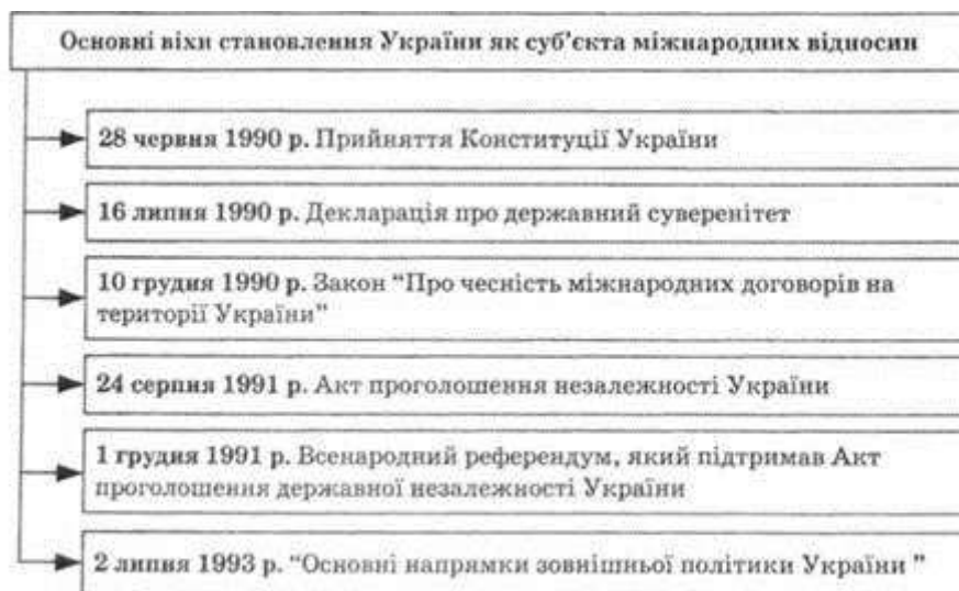
Рис. 15.5. Становлення України як суб'єкта міжнародних відносин

документа під назвою "Основні напрями зовнішньої політики України" (2 липня 1993 р.), в якому викладено концепцію зовнішньополітичної діяльності держави, а згодом, 28 червня 1996 р., тексту Конституції України. У ст. 18 Конституції України, зокрема, наголошено: "Зовнішньополітична діяльність України спрямована на забезпечення її національних інтересів і безпеки шляхом підтримання мирної та взаємовигідної співпраці з членами міжнародного співтовариства за загально визнаними принципами і нормами міжнародного права". Неподільною і недоторканою оголошено територію України і, водночас, відсутність територіальних претензій до будь-якої іншої держави. Основним законом задекларовано також без'ядерний статус країни, оборонний характер її військової доктрини, формування національних Збройних сил на засадах мінімальної достатності. Ключову роль у цьому процесі відіграли результати всенародного референдуму (1 грудня 1991 р.), на якому практично 90 % громадян підтримали Акт проголошення державної незалежності. На рис. 15.5 подано схему основних віх становлення України як суб'єкта міжнародних відносин.