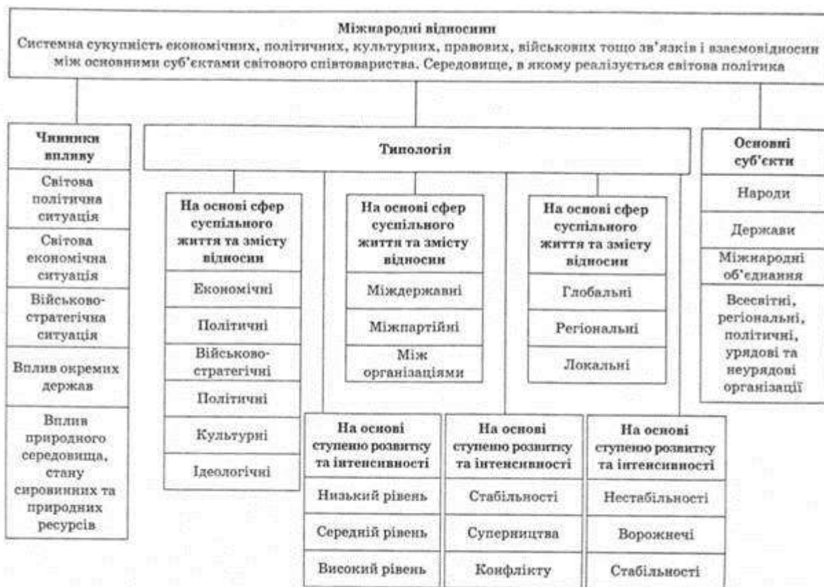
Рис. 15.8. Роль і місце України в системі міжнародних відносин

Щодо двох міжнародних проблем поза Європою, то передусім це аспект розробки паливно-енергетичних ресурсів у країнах СНД, особливо в регіоні Каспійського моря. Для Російської Федерації, де, за влучним висловом колишнього Президента Росії Єльцина, "Каспійське море — це друга Перська затока", боротьба за контроль над шляхами транспортування енергоносіїв між Європою й Азією набуває, окрім економічного, ще й геополітичного значення.